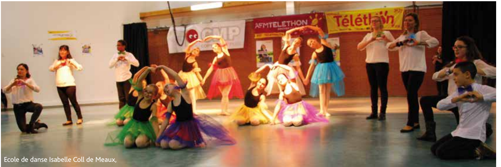
Ecole de danse Isabelle Coll de Meaux,