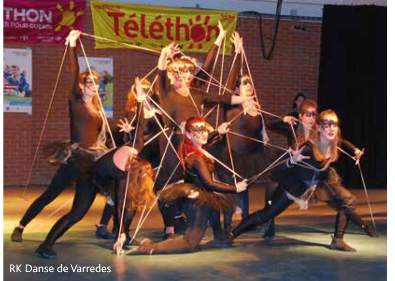
RK Danse de Varredes