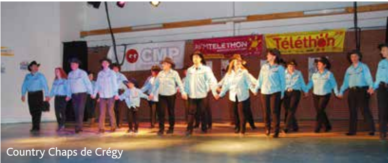
Country Chaps de Crégy