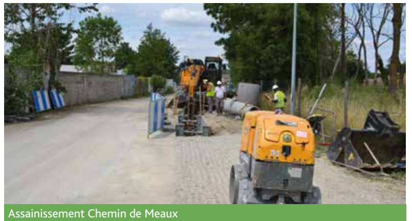
Assainissement Chemin de Meaux