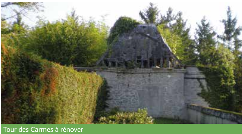
Tour des Carmes à rénover

d'agrandissement de l'école du Blamont et les problèmes de stationnement rencontrés aux horaires scolaires. Les échanges avec les Crégysois se sont déroulés en toute convivialité.