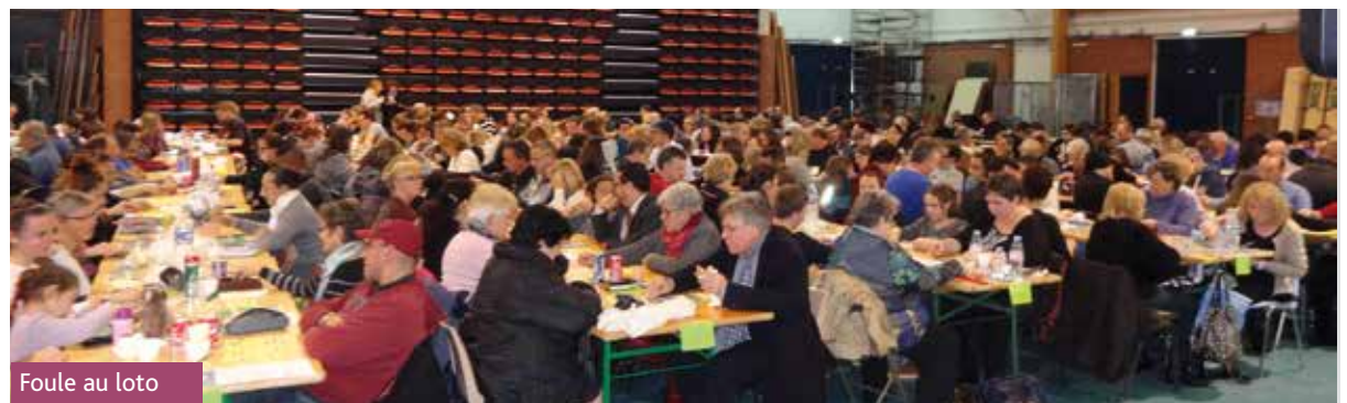
Foule au loto

moins de quarante lots à gagner grâce à de nombreux généreux