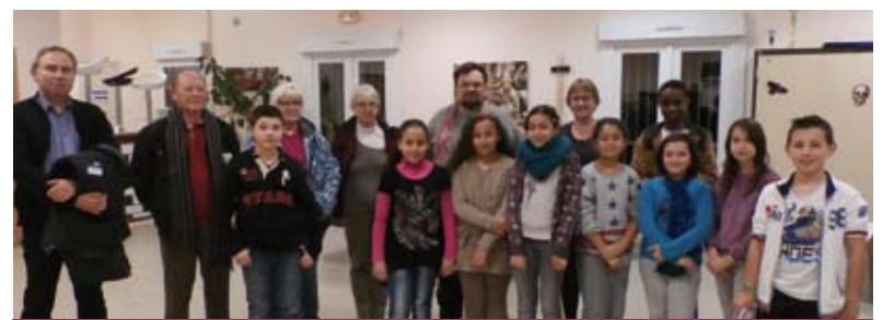
les jeunes avec les élus et les membres du Secours Populaire

Le Conseil Municipal des Jeunes a organisé, avant les fêtes, une collecte de jouets et de jeux sur la commune. Plusieurs centaines ont été apportés sur différents lieux : écoles, collège, mairie, Accueil de loisirs, Maison des jeunes et Carrefour market.