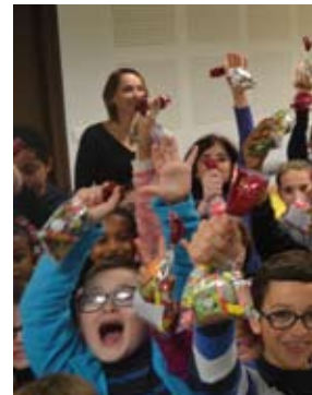
Ecole du Blamont