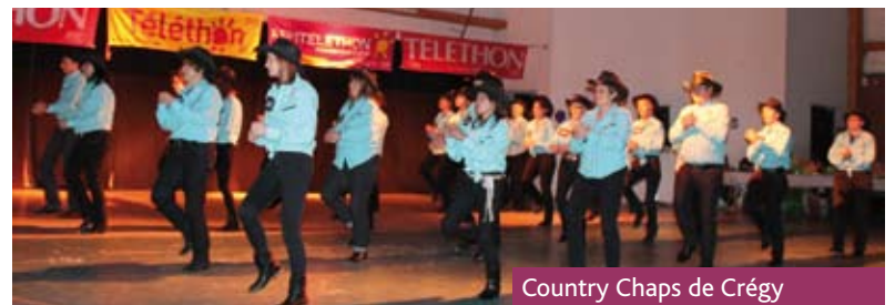
Country Chaps de Crégy