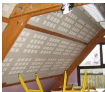
Travaux d'insonorisation Rostand

Les services techniques ont profité des petites vacances scolaires pour carreler les toilettes de l'école du Blamont et procéder à la réfection complète d'un bloc toilettes à l'école Jean-Rostand. Deux salles de restauration de l'école Jean-Rostand ont été insonorisées pour le bien-être et le confort des enfants, ramenant le taux de décibels à la normale !