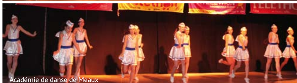
Académie de danse de Meaux