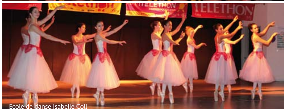
Ecole de danse Isabelle Coll