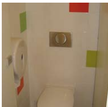
Bloc sanitaire Rostand