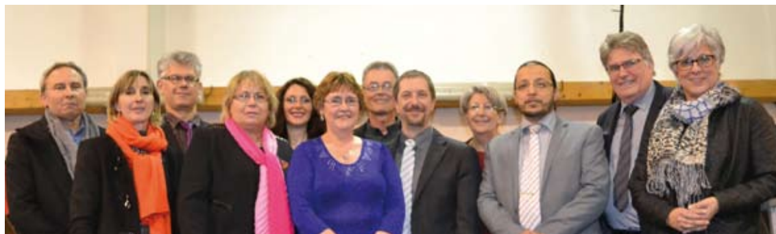
Une partie des élus présents aux Voeux du maire de Crégy