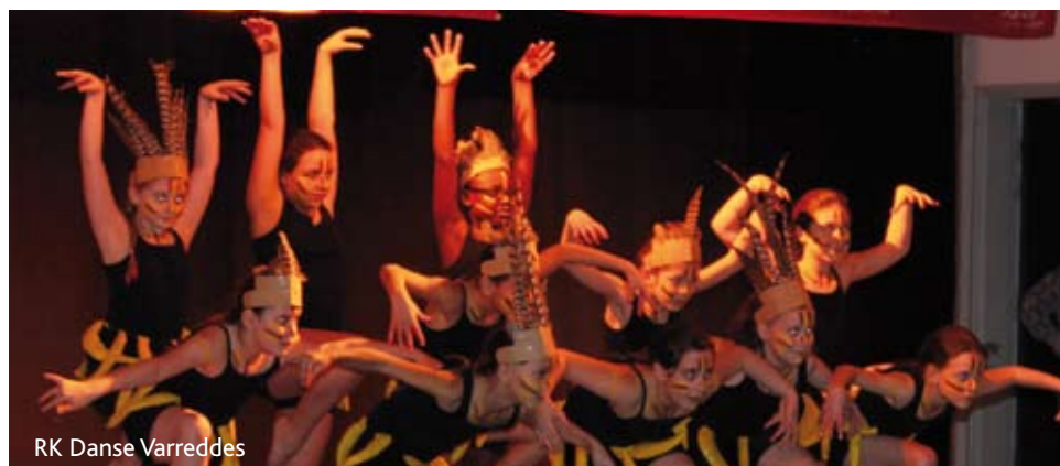
RK Danse Varreddes

Décembre. Noël de la crèche Les tout-petits, eux aussi, ont la visite du Père Noël, après le spectacle proposé par la crèche « Les Loupiots ».