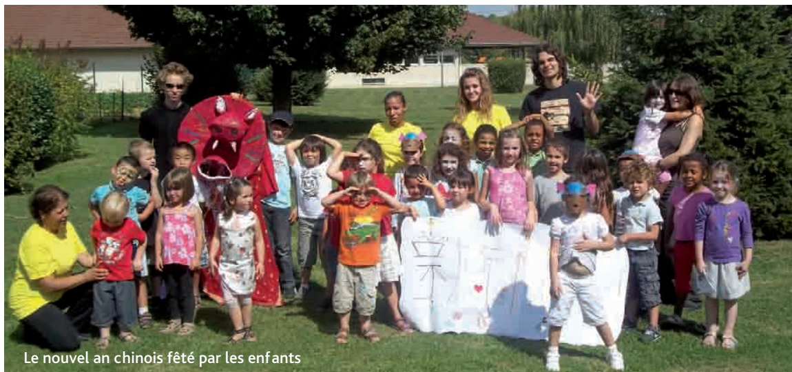
Le nouvel an chinois fêté par les enfants

Au cours de l'été, les enfants ont pu vivre des aventures extraordinaires à l'accueil de loisirs. Au mois de juillet, les enfants ont vécu la plage sous toutes ses formes allant même jusqu'à une sortie à Fort Mahon. Au mois d'août, ils sont partis du Far West pour revenir à Crégy en faisant un tour du monde au travers d'activités de découverte culturelle.