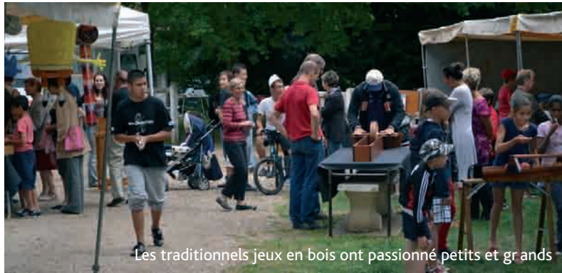
Les traditionnels jeux en bois ont passionné petits et grands

Le 14 juillet, la journée des associations, et la fête de la Pomme, l'été Crégysois a été rythmé par de nombreuses manifestations, retour en images sur ces événements