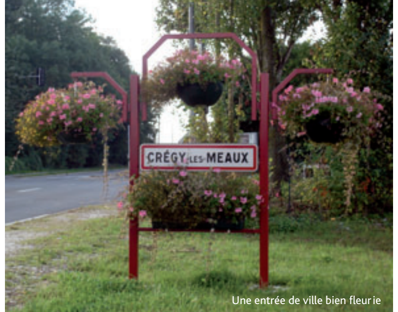
Une entrée de ville bien fleurie