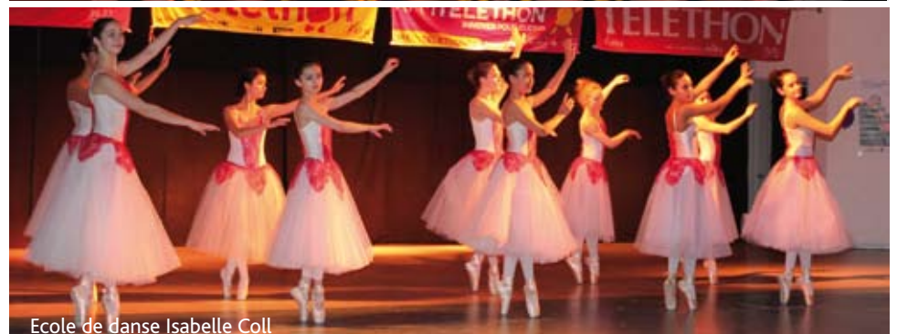
Ecole de danse Isabelle Coll