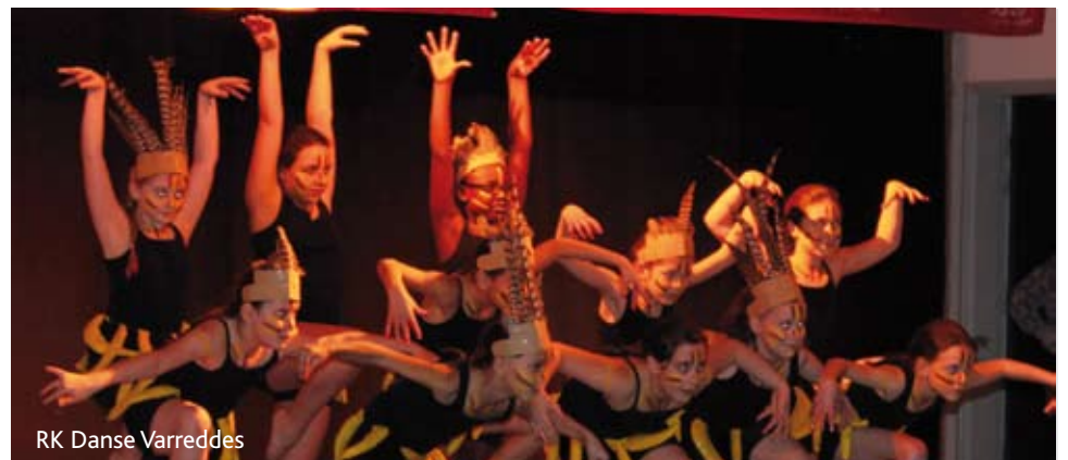
RK Danse Varreddes