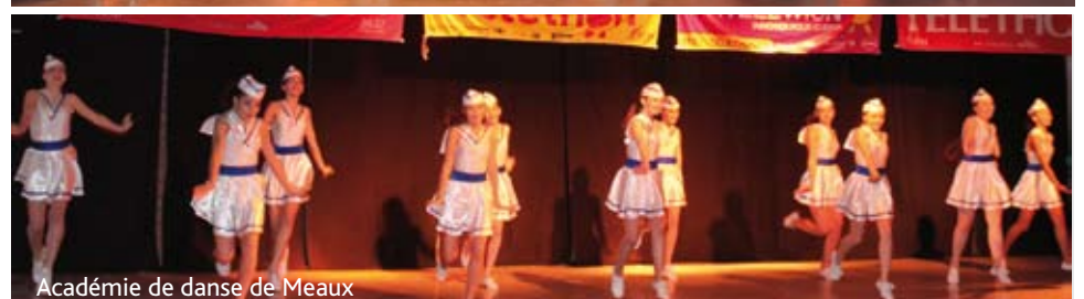
Académie de danse de Meaux