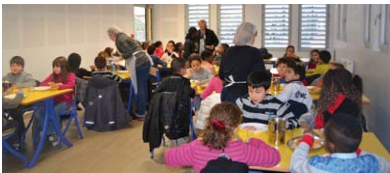
A l'heure du déjeuner