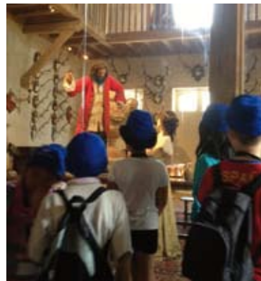
Le musée du conte

Au mois d'août, les activités ont tourné autour du recyclage sur le thème : « Trois fois rien ». Les enfants ont créé « la mascotte