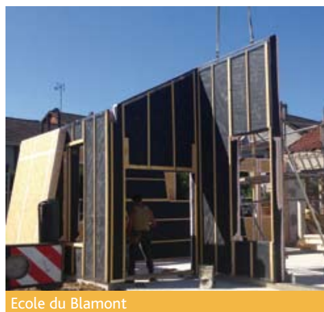
Ecole du Blamont

A l'école du Blamont les travaux, réalisés à 60 %, suivent leur cours. Ils ont été présentés sur plan dès le mois de juin lors d'une rencontre avec les parents d'élèves.