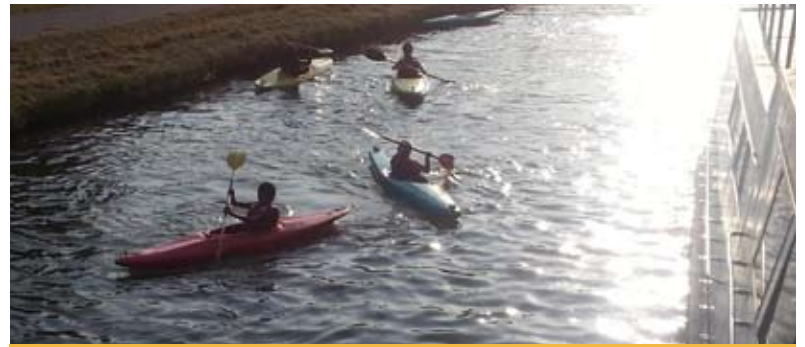
Coucher de soleil sur le Canal du nivernais

En juillet, trois jeunes de Crégy et onze de Bussy-Saint-Georges, ont effectué cinq jours de navigation le long du canal du Nivernais, de