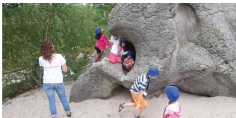
Les enfants découvrent les rochers de la Hottée du Diable